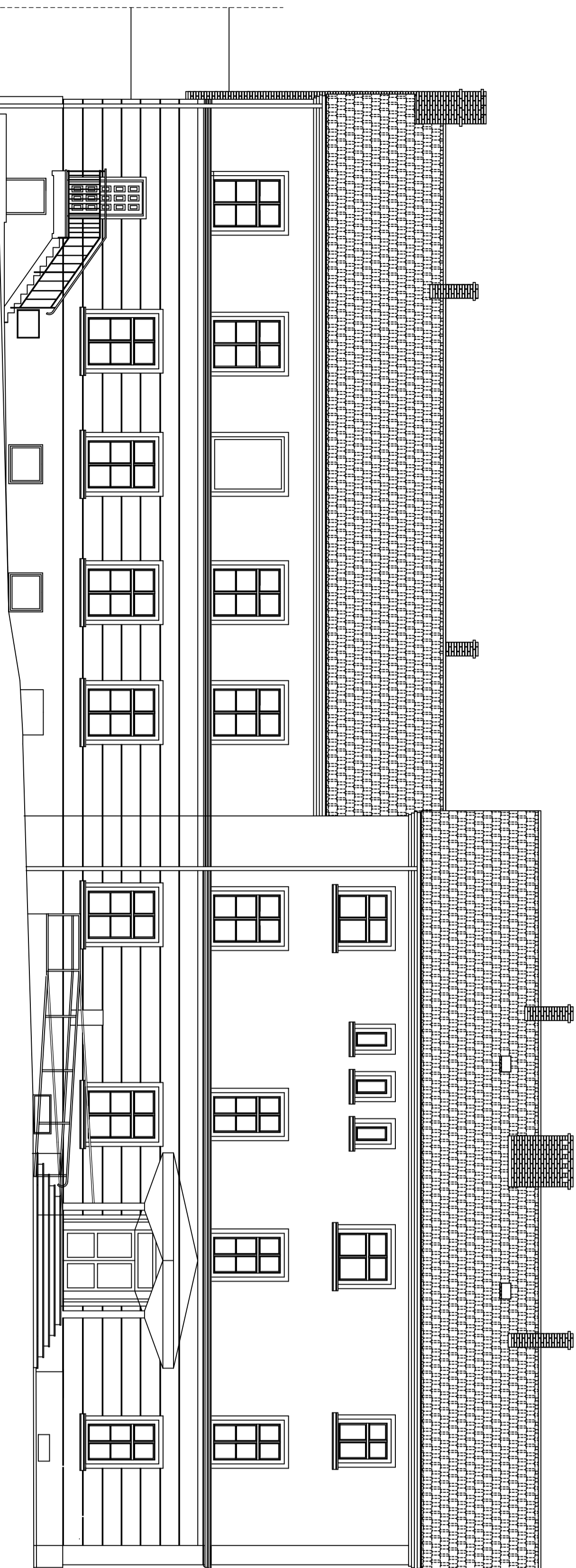
ELEWACJA POŁUDNIOWO – WSCHODNIA