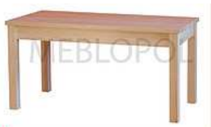
Stół 75 x 145 x 80 cm Zdjęcie poglądowe